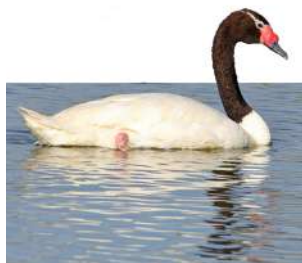
3. CISNE CUELLO NEGRO ♂ 80 ( Cygnus melancoryphus )