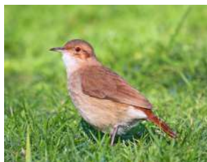
66. HORNERO ♂ 18 (Furnarius rufus) AR-MA-PA | MC | RE | N