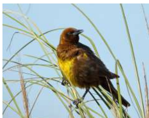
113. PECHO AMARILLO ↑ 21 ( Pseudoleistes virescens )