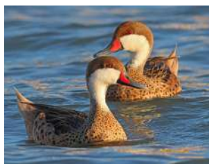
9. PATO GARGANTILLA ♂ 35 ( Anas bahamensis )