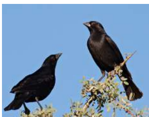
109. TORDO PICO CORTO ↑ 18 ( Molothrus rufoaxillaris )