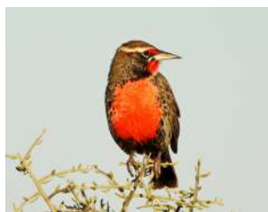
108. LOICA ↑ 22 ( Leistes loyca )