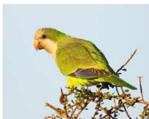
62. COTORRA ♂ 27 (Myiopsitta monachus) AR-MA-PA | MC | RE | N