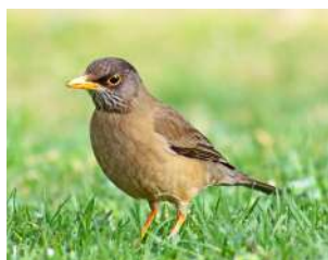
96. ZORZAL PATAGÓNICO ↑ 24 ( Turdus flackandii )