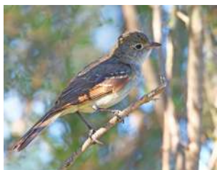
76. FIOFÍO PICO CORTO \uparrow 13 ( Elaenia parvirostris )