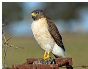
45. TAGUATÓ ♂ 34 ( Rupornis magnirostris )