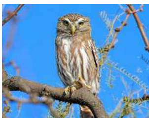
49. CABURÉ CHICO \uparrow 16 ( Glaucidium brasilianum )