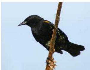
112. VARILLERO ALA AMARILLA ↑ 17 ( Agelasticus thilius )