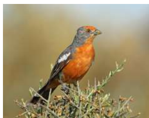
75. CORTARRAMAS \uparrow 17 ( Phytotoma rutila )