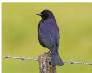
110. TORDO RENEGRIDO ↑ 19 ( Molothrus bonariensis )