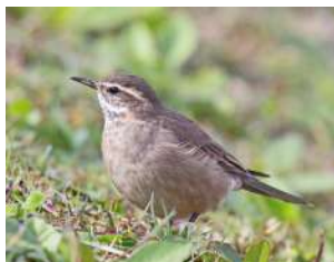
68. REMOLINERA Parda ♂ 16 (Cinclodes fuscus) HU | ES | VI