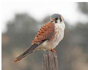
59. HALCONCITO COLORADO \uparrow ♂ 25 \uparrow ♀ 28 ( Falco sparverius )