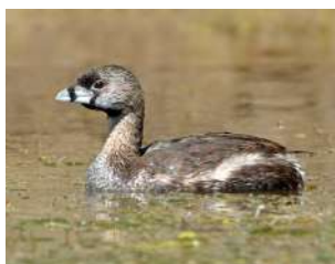
13. MACÁ PICO GRUESO \uparrow 28 ( Podilymbus podiceps )