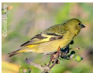
103. VERDERÓN ↑ 14 ( Chloris chloris )