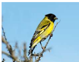
105. CABECITANEGRA ↑ 12 ( Spinus magellanicus )