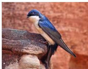
90. GOLONDRINA BARRANQUERA ↑ 12 ( Pygochelidon cyanoleuca )