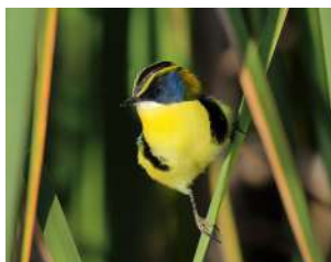
89. TACHURÍ SIETECOLORES ↑ 10 ( Tachuris rubrigastra )