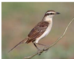
99. CALANDRIA GRANDE ↑ 25 ( Mimus saturninus )