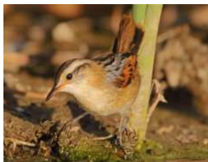
67. JUNQUERO ♂ 13 (Phleocryptes melanops) HU | CO | RE | N