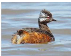
12. MACÁ CARA BLANCA ♂ 23 ( Rollandia rolland )