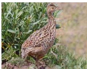
1. INAMBÚ CAMPESTRE ♂ 25 ( Nothura maculosa )