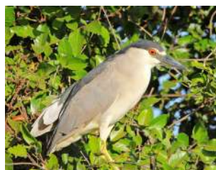
33. GARZA BRUJA \uparrow 47 ( Nycticorax nycticorax )