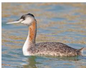
14. MACÁ GRANDE \uparrow 44 ( Podiceps mayor )