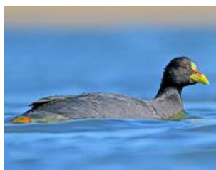
25. GALLARETA LIGAS ROJAS \uparrow 35 ( Fulica armillata )