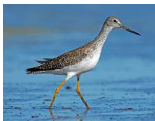
28. PITOTOY GRANDE \uparrow 29 ( Tringa melanoleuca )