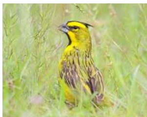
119. CARDENAL AMARILLO ↑ 18 ( Gubernatrix cristata )