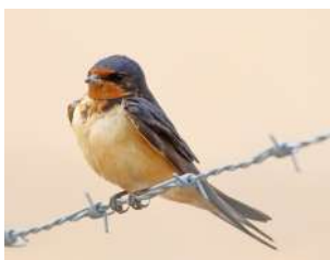
94. GOLONDRINA TIJERITA ↑ 15 ( Hirundo rustica )