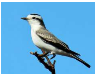
88. MONJITA CORONADA ↑ 20 ( Xolmis coronatus )