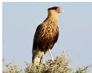
57. CARANCHO \uparrow 55 ( Caracara plancus )