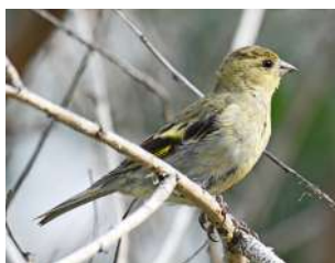
106. SILVESTRÍN ↑ 13 ( Spinus cf. barbatus )