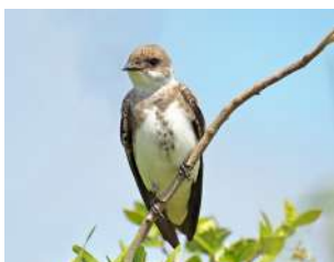
91. GOLONDRINA PARDA ↑ 16 ( Progne tapera )