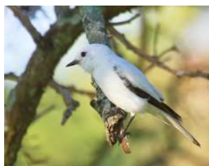
87. MONJITA BLANCA ↑ 17 ( Xolmis irupero )