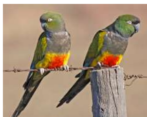
63. LORO BARRANQUERO ♂ 42 (Cyanoliseus patagonus) AR-MA-PA | MC | RE | N | (!)