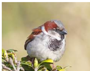
102. GORRIÓN ↑ 13 ( Passer domesticus )