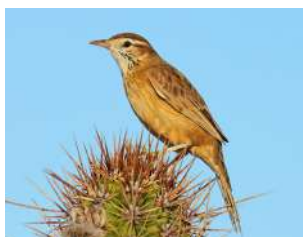
70. LEÑATERO ♂ 18 (Anumbius annumbi) AR-MA | RA | RE | N