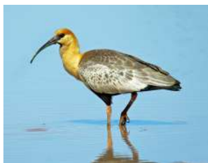
40. BANDURRIA AUSTRAL ♂ 57 ( Theristicus melanopis )