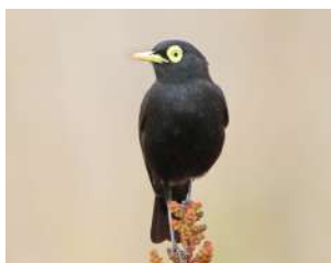
86. PICO DE PLATA ↑ 13 ( Hymenops perspicillatus )