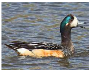
8. PATO OVERO ♂ 37 ( Mareca sibilatrix )