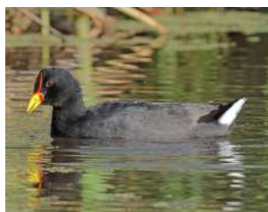
24. GALLARETA ESCUDETE ROJO \uparrow 32 ( Fulica rufifrons )