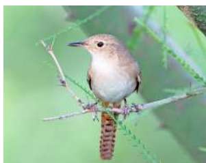
95. RATONA ↑ 10 ( Troglodytes aedon )