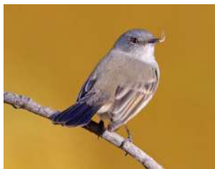
79. PIOJITO GRIS \uparrow 11 ( Serpophaga nigricans )