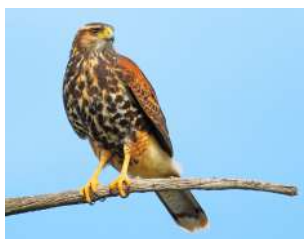
46. GAVILÁN MIXTO ♂ 48 ♀ 54 ( Parabuteo unicinctus )