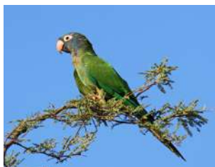
64. CALANCATE CABEZA AZUL ♂ 35 (Thectocercus acuticaudatus) AR | ES | VI