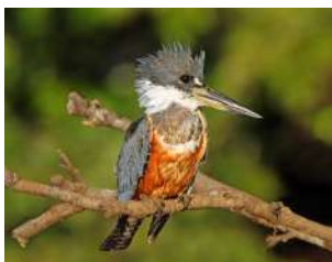
52. MARTÍN PESCADOR GRANDE \uparrow 36 ( Megasceryle torquata )