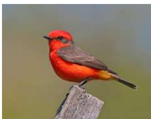
85. CHURRINCHE ↑ 13 ( Pyrocephalus rubinus )