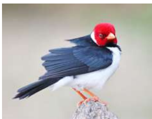
121. CARDENILLA ( Paroaria capitata )