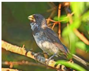
116. CORBATTA ↑ 10 ( Sporophila caerulescens )