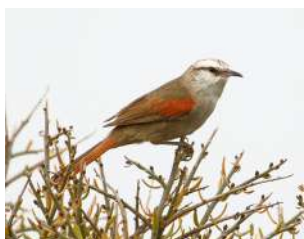
73. CURUTIÉ BLANCO \uparrow 14 ( Cranioleuca pyrrhophia )