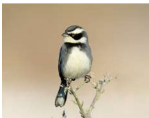
118. MONTERITA DE COLLAR ↑ 12 ( Microspingus torquatus )