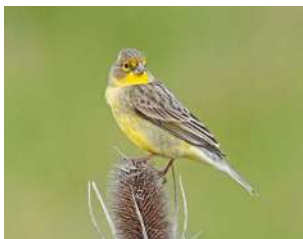
115. MISTO ↑ 12 ( Sicalis luteola )