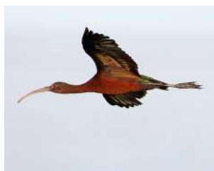
39. CUERVILLO DE CAÑADA ♂ 51 ( Plegadis chihi )