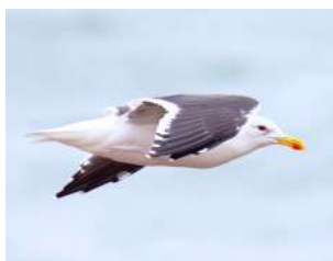
31. GAVIOTA COCINERA \uparrow 55 ( Larus dominicanus )