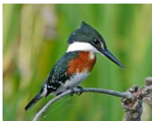
53. MARTÍN PESCADOR CHICO \uparrow 17 ( Chloroceryle americana )