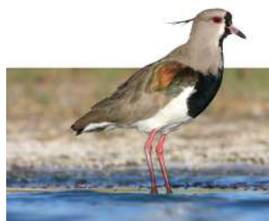
27. TERO \uparrow 31 ( Vanellus chilensis )