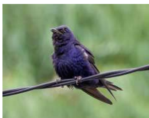
92. GOLONDRINA NEGRA ↑ 18 ( Progne elegans )