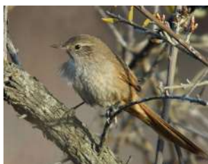
71. CANASTERO COLUDO ♂ 15 (Asthenes pyrrholeuca) MA | ES | VE | NP