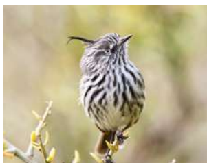
77. CACHUDITO PICO NEGRO \uparrow 10 ( Anairetes parulus )