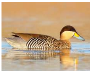
5. PATO CAPUCHINO ♂ 31 ( Spatula versicolor )