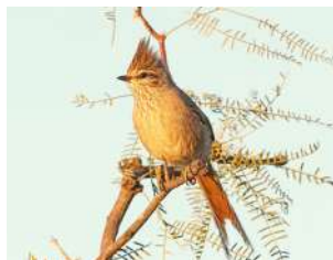
69. COLUDITO COPETÓN ♂ 16 (Leptasthenura platensis) MA | RA | RE-VI