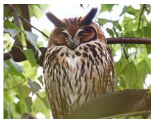
51. LECHUZÓN OREJUDO \uparrow 36 ( Asio clamator )