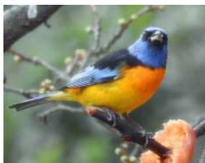
122. NARANJERO ( Pipraeidea bonariensis )