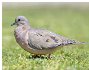
18. TORCAZA \uparrow 22 ( Zenaida auriculata )