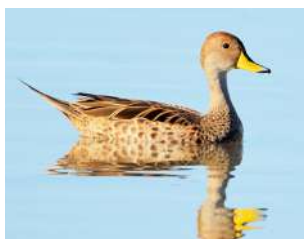
10. PATO MAICERO ♂ 39 ( Anas georgica )