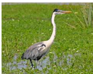
35. GARZA MORA \uparrow 75 ( Ardea cocoi )