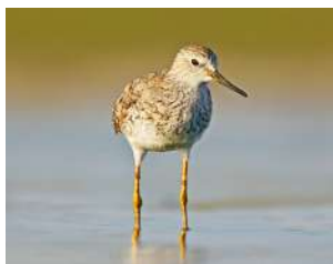
29. PITOTOY CHICO \uparrow 23 ( Tringa flavipes )