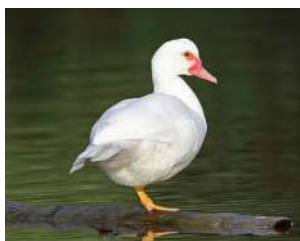
2. PATO CRIOLLO forma doméstica ♂ 65 ( Cairina moschata ) ♀ 53