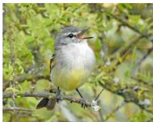
80. PIOJITO VIENTRE AMARILLO \uparrow 9 ( Serpophaga subcristata )