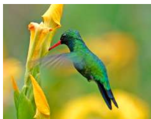
21. PICAFLOR VERDE \uparrow 7 ( Chlorostilbon lucidus )