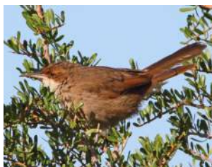
65. BANDURRITA CHAQUEÑA ♂ 16 (Tarphonomus certhioides) MA | RA | RE