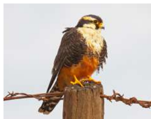
60. HALCÓN PLOMIZO \uparrow ♂ 33 \uparrow ♀ 38 ( Falco femoralis )