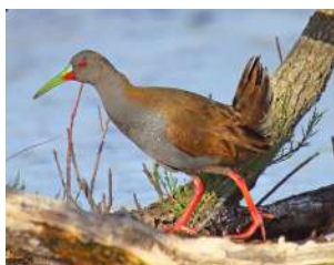
23. GALLINETA PICO PINTADO \uparrow 27 ( Pardirallus sanguinolentus )