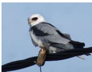
43. MILANO BLANCO ♂ 35 ( Elanus leucurus )