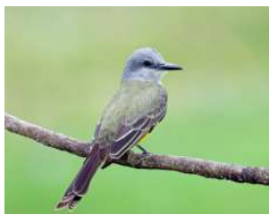
83. SUIRIRÍ REAL \uparrow 20 ( Tyrannus melancholicus )