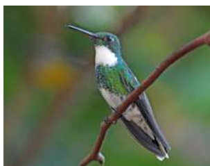
22. PICAFLOR GARGANTA BLANCA \uparrow 8 ( Leucochloris albicollis )