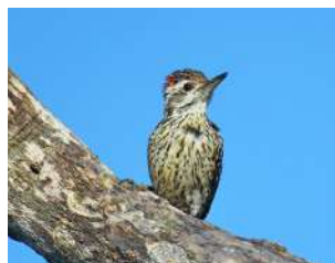
54. CARPINTERO BATARÁZ CHICO \uparrow 15 ( Dryobates mixtus )