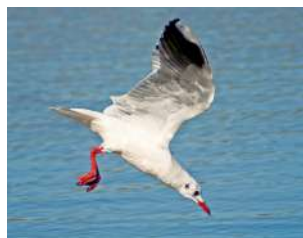
30. GAVIOTA CAPUCHO CAFÉ \uparrow 35 ( Chroicocephalus maculipennis )