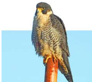
61. HALCÓN PEREGRINO ♂ 37 (Falco peregrinus) ♀ 42 VO | RA | VI-VE