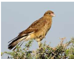
58. CHIMANGO \uparrow 37 ( Milvago chimango )