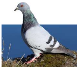
15. PALOMA DOMÉSTICA \uparrow 32 ( Columba livia )