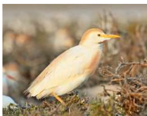
34. GARCITA BUEYERA \uparrow 35 ( Bubulcus ibis )