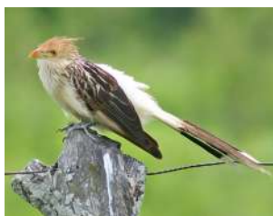
20. PIRINCHO \uparrow 36 ( Guira guira )