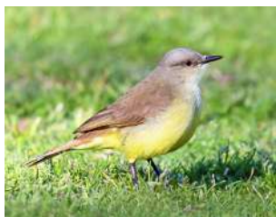
82. PICABUEY \uparrow 17 ( Machetornis rixosa )