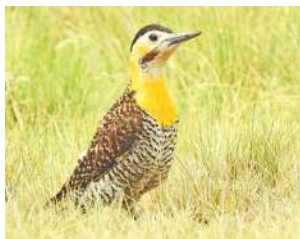
56. CARPINTERO CAMPESTRE \uparrow 28 ( Colaptes campestris )