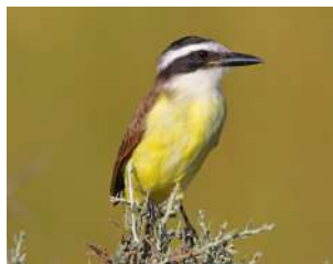
81. BENTEVEDO \uparrow 22 ( Pitangus sulphuratus )