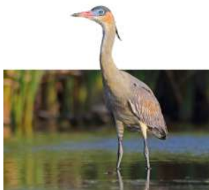
37. CHIFLÓN ♂ 48 ( Syrigma sibilatrix )