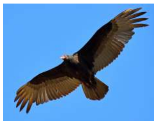
42. JOTE CABEZA COLORADA ♂ 55 ( Cathartes aura )