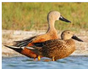
6. PATO CUCHARA ♂ 36 ( Spatula platalea )