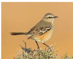
98. CALANDRIA MORA ↑ 22 ( Mimus patagonicus )