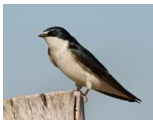
93. GOLONDRINA CEJA BLANCA ↑ 13 ( Tachycineta leucorrhoa )