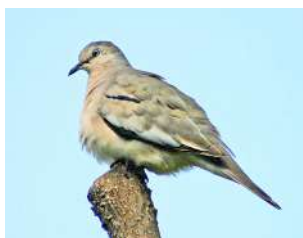
19. TORCACITA PICUÍ \uparrow 15 ( Columbina picui )