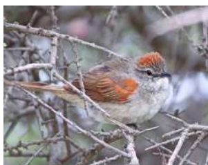
74. PIJÚ COLA PARDA \uparrow 14 ( Synallaxis albescens )