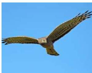
44. GAVILÁN CENICIENTO ♂ 40 ♀ 48 ( Circus cinereus )