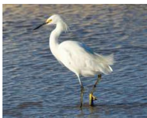
38. GARCITA BLANCA ♂ 40 ( Egretta thula )