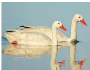
4. COSCOROBA ♂ 65 ( Coscoroba coscoroba )