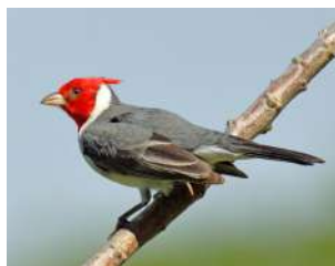
120. CARDENAL COPETE ROJO ↑ 17 ( Paroaria coronata )