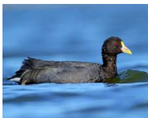
26. GALLARETA CHICA \uparrow 30 ( Fulica leucoptera )