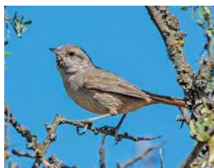
72. CANASTERO CHAQUEÑO ♂ 14 (Asthenes baeri) MA | RA | RE | NP