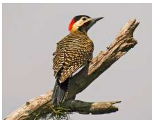
55. CARPINTERO REAL \uparrow 23 ( Colaptes melanochloros )