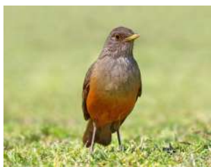
97. ZORZAL COLORADO ↑ 23 ( Turdus rufiventris )