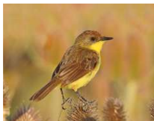
78. DORADITO PAMPEANO \uparrow 10 ( Pseudocolopteryx flaviventris )