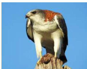
47. AGUILUCHO ÑANCO ♂ 44 ♀ 52 ( Geranoaetus polyosoma )