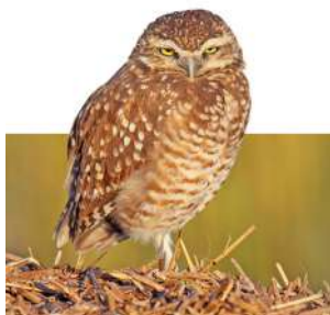
50. LECHUCITA VIZCACHERA \uparrow 25 ( Athene cunicularia )