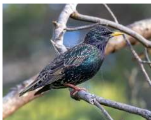
101. ESTORNINO PINTO ↑ 20 ( Sturnus vulgaris )