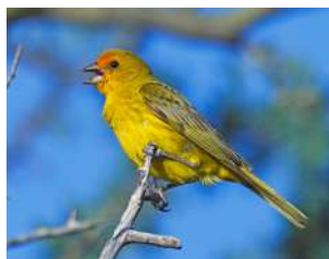
114. JILGUERO DORADO ↑ 12 ( Sicalis flaveola )