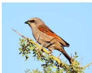
111. TORDO MÚSICO ↑ 18 ( Agelaioides badius )