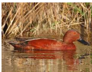
7. PATO COLORADO ♂ 36 ( Spatula cyanoptera )