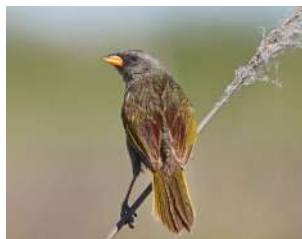
117. VERDÓN ↑ 20 ( Embernagra platensis )