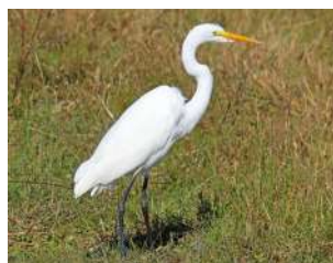
36. GARZA BLANCA \uparrow 65 ( Ardea alba )