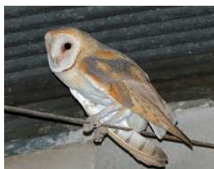
48. LECHUZA DE CAMPANARIO ♂ 36 ( Tyto alba )