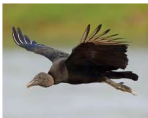
41. JOTE CABEZA NEGRA ♂ 53 ( Coragyps atratus )