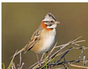
107. CHINGOLO ↑ 12 ( Zonotrichia capensis )