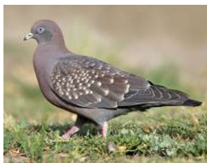
17. PALOMA MANCHADA \uparrow 32 ( Patagioenas maculosa )