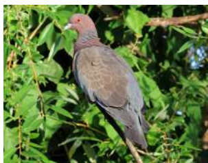
16. PALOMA PICAZURÓ \uparrow 34 ( Patagioenas picazuro )