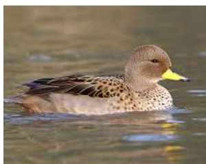
11. PATO BARCINO ♂ 33 ( Anas flavirostris )