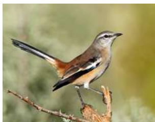
100. CALANDRIA REAL ↑ 20 ( Mimus triurus )