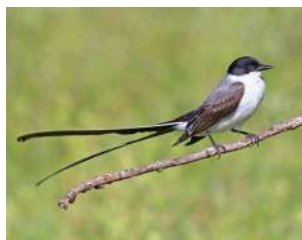
84. TIJERETA \uparrow ♂ 39 \uparrow ♀ 29 ( Tyrannus savana )