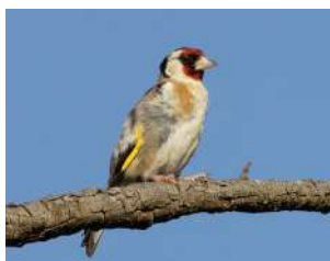
104. CARDELINO ↑ 12 ( Carduelis carduelis )